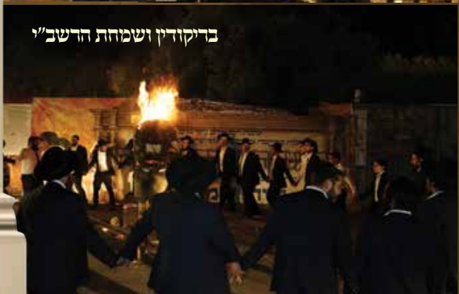
בדיקודין ושמחת הרשב"י