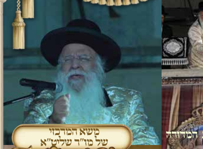
משיא המדבזי של מר"ד שליט"א