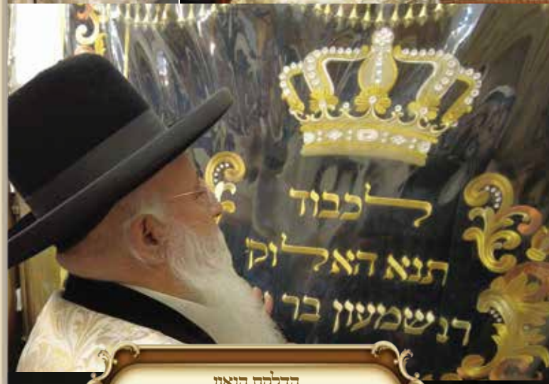
הדלקת הגאון ראש כולל נחד שלום שליט"א במוצאי ל"ג בעומר