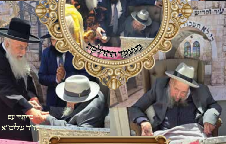
בריקוד עם מר"ד שליט"א